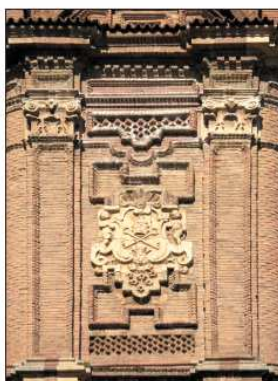
Portada de la iglesia de Torrijo y detalle de la torre.