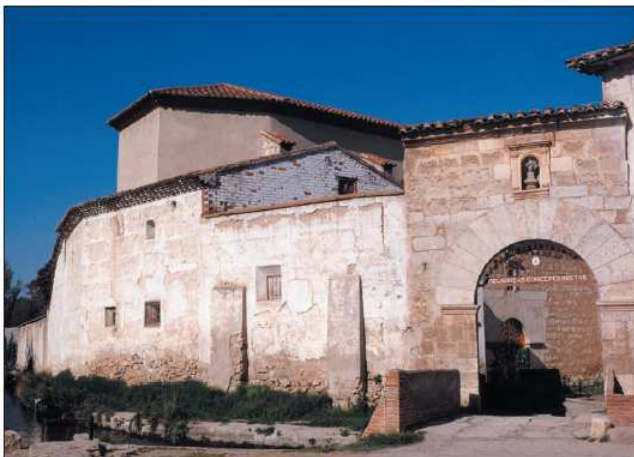
Los conventos femeninos de San Valentín en Báguena y de San Miguel Arcángel en Calamocha.