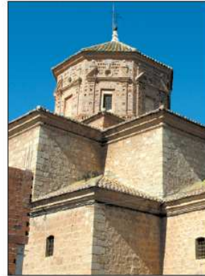
Las naves de la iglesia de Caminreal están construidas a diferentes alturas, apreciándose una curiosa volumetría desde el exterior.

Ferreruela de Huerva: se construyó entre 1725 y 1733 por el maestro de obras Miguel Borgas. La nave central destaca en altura sobre las laterales. En su exterior destacan algunos elementos: por una