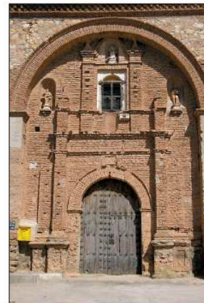
Portada de la iglesia de Lagueruela.

El templo de Collados fue construido entre 1757 y 1763, dotándolo de una interesante decoración interior. La torre fue derribada en 1982.