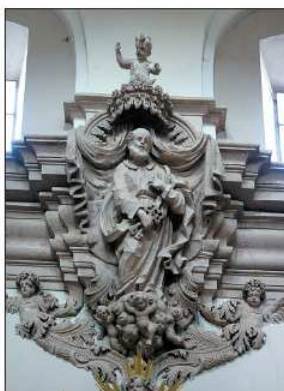
Estucos en el interior de la iglesia de Villafranca.