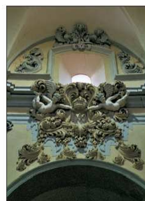
Estucos en la iglesia de Pozuel.