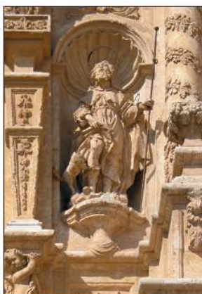
La portada-retablo de Calamocha es uno de los ejemplos más interesantes del barroco aragonés.

Sin embargo es su espectacular portada, sin duda una de las más importantes del barroco aragonés, lo más llamativo de esta ampliación. Bajo un arco rebajado aparecen, como en un gran retablo, las tallas en piedra de los patronos la Virgen de los Ángeles y San Roque, entre otros. En sus dos cuerpos, de tres calles cada uno, veremos columnas lisas en el inferior, mientras que en el superior aparecen otras con guirnaldas y estípites. Los motivos rococó se hacen también presentes en el conjunto. Se fecha en 1751. Desconocemos quién es el autor. En esa época estaban activos en la zona los escultores de la familia Navarro y José Gutiérrez, pero no se puede afirmar nada sobre la autoría. Un elemento interesante de este templo es el cancel de madera colocado a la entrada. En la parte superior están talladas las virtudes teologales, en un trabajo que recuerda a los hermanos Navarro. Toda la fachada se culmina en forma apuntada y con un perfil movido de curvas convexas y cóncavas y una espadaña en la parte superior.