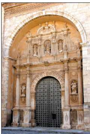
La torre y portada de Burbáguena son unos de los ejemplos más interesantes de la comarca.

erigida hacia 1780 y cobijada por un arco, es de las más interesantes de la comarca. Presenta dos cuerpos. El inferior está dividido en tres calles por dos pares de columnas estriadas y capitel que recuerda a los corintios. En medio de cada par de columnas una hornacina con una talla. Unos triglifos aparecen en el friso. El segundo cuerpo aparece también dividido en tres calles con otras tantas hornacinas con esculturas. Separándolas aparecen dos estípites y, en los extremos, sobre las columnas del piso inferior, cuatro “jarrones” o “trofeos”. Entre ellos se ven sendos “aleros” estilizados, que recuerdan los utilizados a finales del siglo XVII, y que marcan la transición entre los dos pisos. Todo se culmina con un frontón curvo partido.