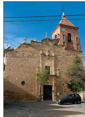
La construcción del templo de Ojos Negros comenzó en 1751.