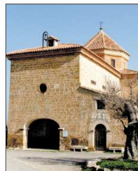
La ermita de la Virgen del Moral de El Poyo destaca por su atrio con arco rebajado.