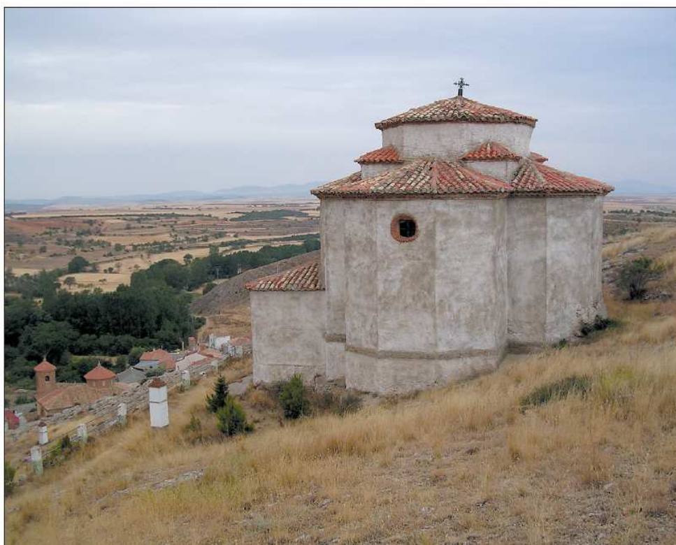
Ermita del Santo Sepulcro en Lagueruela, de 1744.

Santa Cruz de Nogueras: Es la única de la que no se tienen noticias sobre el momento de su construcción. Sus cuatro lados semicirculares están levanta-