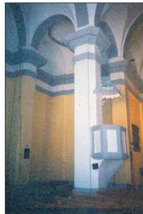
Iglesia de Nogueras.

Se trata de templos construidos en mampostería y ladrillo, inspirados sin duda en la zaragozana iglesia de la Santa Cruz, concluida en 1780, aunque con