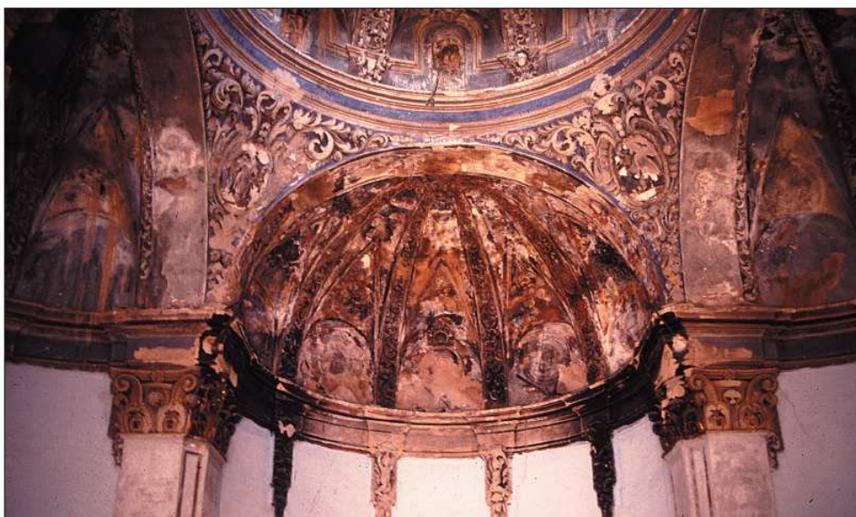
Ermita de San Roque de Loscos. Pinturas murales barrocas.

La ermita de San Roque, de Loscos, es uno de los ejemplos más hermosos de planta de cruz griega.