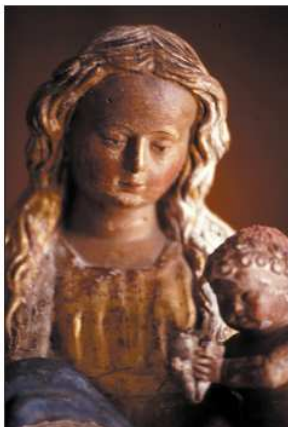
La ermita de Pelarda acoge también la devoción a la Virgen del Mar.